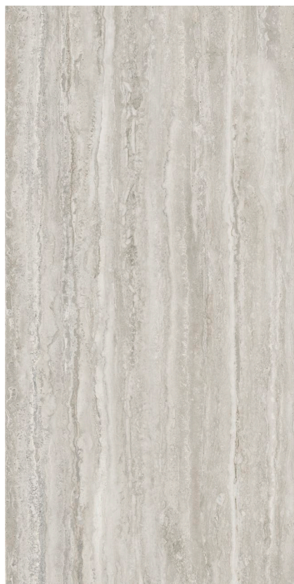
ARGENTO 30 x 60 cm (12" x 24") fini mat KJ.TR.ARG.1224