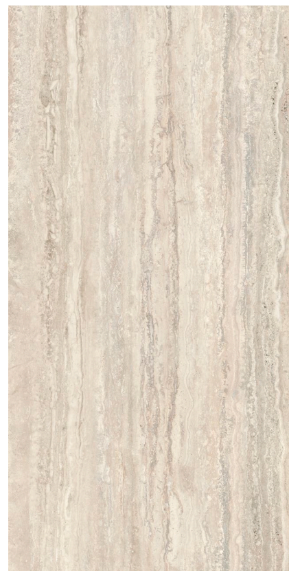
CREMA 30 x 60 cm (12" x 24") fini mat KJ.TR.CRM.1224

Tous les items présentés dans ce document font partie du programme d'inventaire Olympia. Pour les commandes spéciales, veuillez contacter votre représentant de Tuiles Olympia.