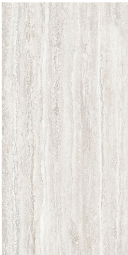
BIANCO 30 x 60 cm (12" x 24") fini mat KJ.TR.BIA.1224